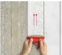
6) C100 OVER

potom použite špeciálne farebné pero PIXEL a naznačte zvisle čiary podľa požadovanej veľkosti