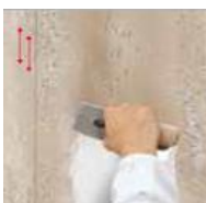
7) C100 OVER

potom naneste vrstvu neriedeného C100 OVER tónovaného do požadovaného farebného odtieňa špachtľou PV 43 v zvislých pruhoch zhora nadol