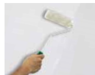
1) PRIMER 1200

nanášajte jednu vrstvu PRIMER 1200 riedeného vodou 15% - 20 % s valčekom vo všetkých smeroch a nechajte schnúť 6 hodín pri teplote 20°C