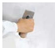
2) METEORE 10

nanášajte jednu vrstvu PRIMER 1200 riedeného vodou 15% - 20 % s valčekom vo všetkých smeroch a nechajte schnúť 6 hodín pri teplote 20°C