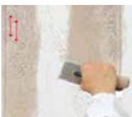
6) C100 OVER

potom použite špeciálne farebné pero PIXEL a naznačte zvisle čiary podľa požadovanej veľkosti