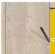
8) - PIXEL

potom naneste vrstvu neriedeného C100 OVER tónovaného do požadovaného farebného odtieňa špachtľou PV 43 v zvislých pruhoch zhora nadol